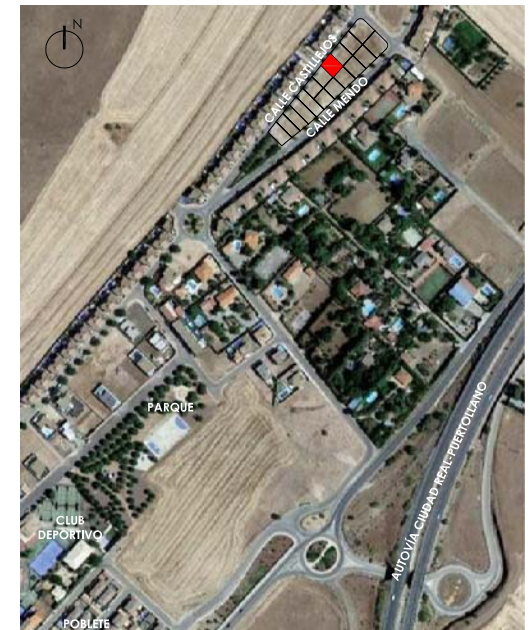
VIVIENDA PARCELAS 8