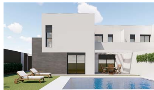
VIVIENDA TIPO 2