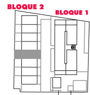
BLOQUE 2. VIVIENDA 4