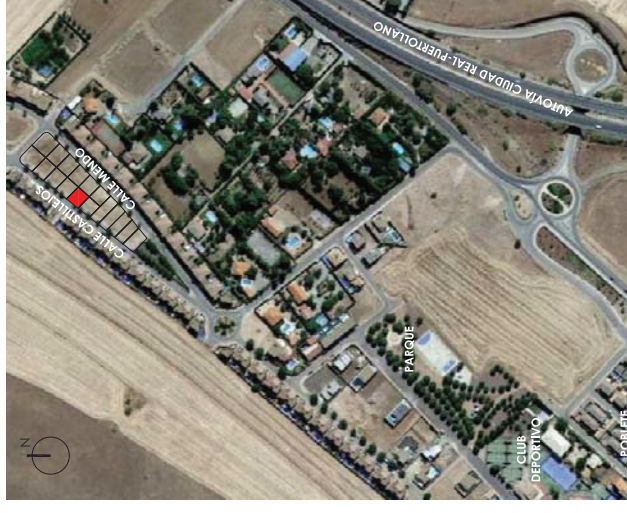
VIVIENDA CASTILLEJOS 7 8

ESCALA GRÁFICA PLANOS DISTRIBUCIÓN (metros)