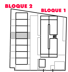
BLOQUE 2. VIVIENDA 5